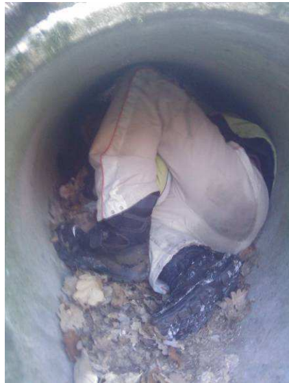
Roman v rouře